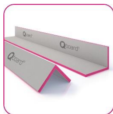
Qboard® qorner reno