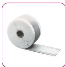
ou Bande d'étanchéité