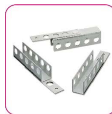
Befestigungsanker oder BOARD-FIX