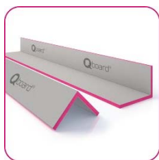
Qboard® qorner reno