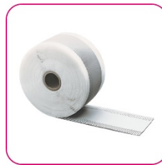
oder Dichtband im Nassbereich